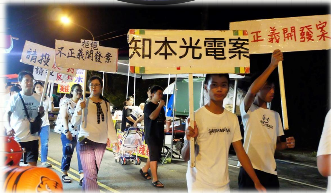
知本溼地建太陽能光電廠 環團憂生態