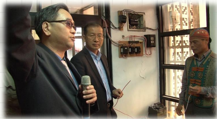
達魯瑪克能源自主小型風機啟用